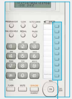
Botones de discado de un toque

Puede almacenar hasta 20 números telefónicos en botones de discado de un toque (10 números en la memoria superior y 10 números en la memoria inferior). Los botones de discado de un toque ahorran tiempo y dificultad al momento de llamar a un cliente o colega con quien habla frecuentemente.